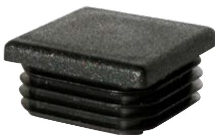
Embout Tube carré