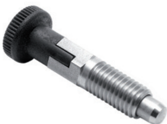
Version C avec écrou